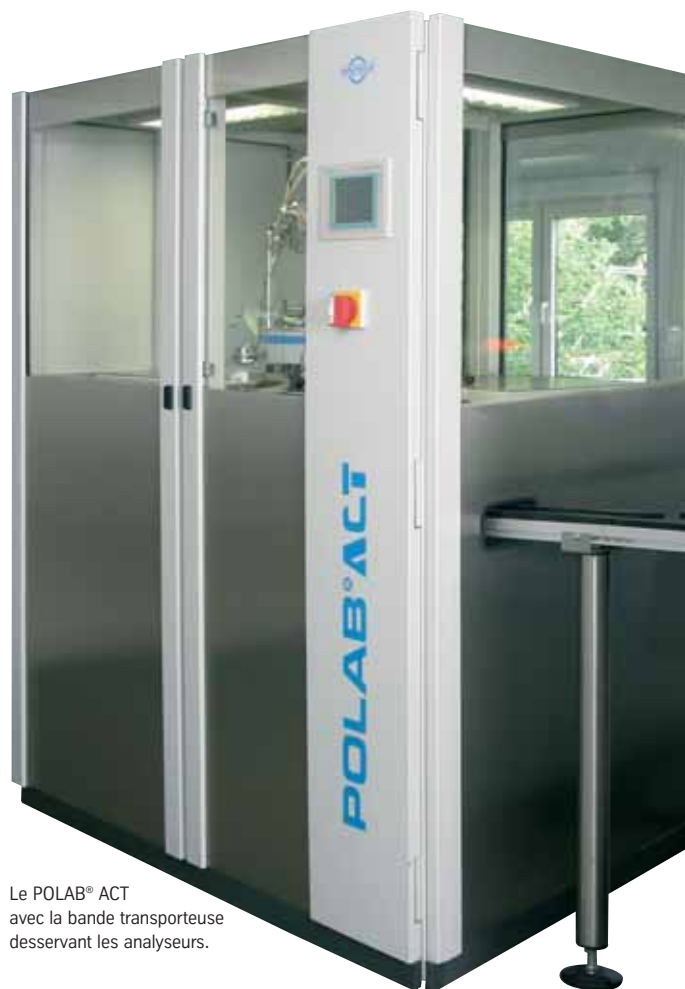
Le POLAB® ACT avec la bande transporteuse desservant les analyseurs.

Le POLAB® ACT avec la pièce maîtresse de la préparation des échantillons – le POLAB® APM.