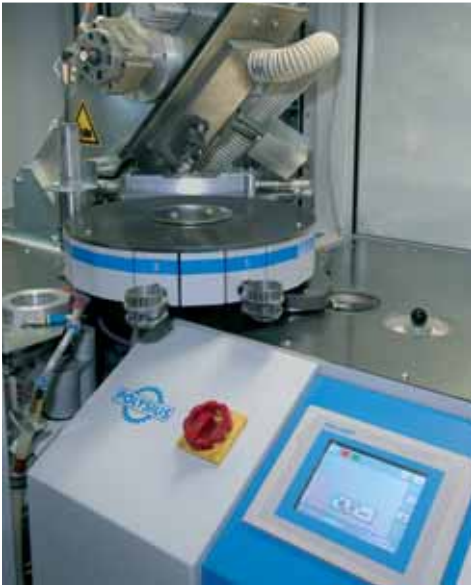
Poste automatique de réception des échantillons ...